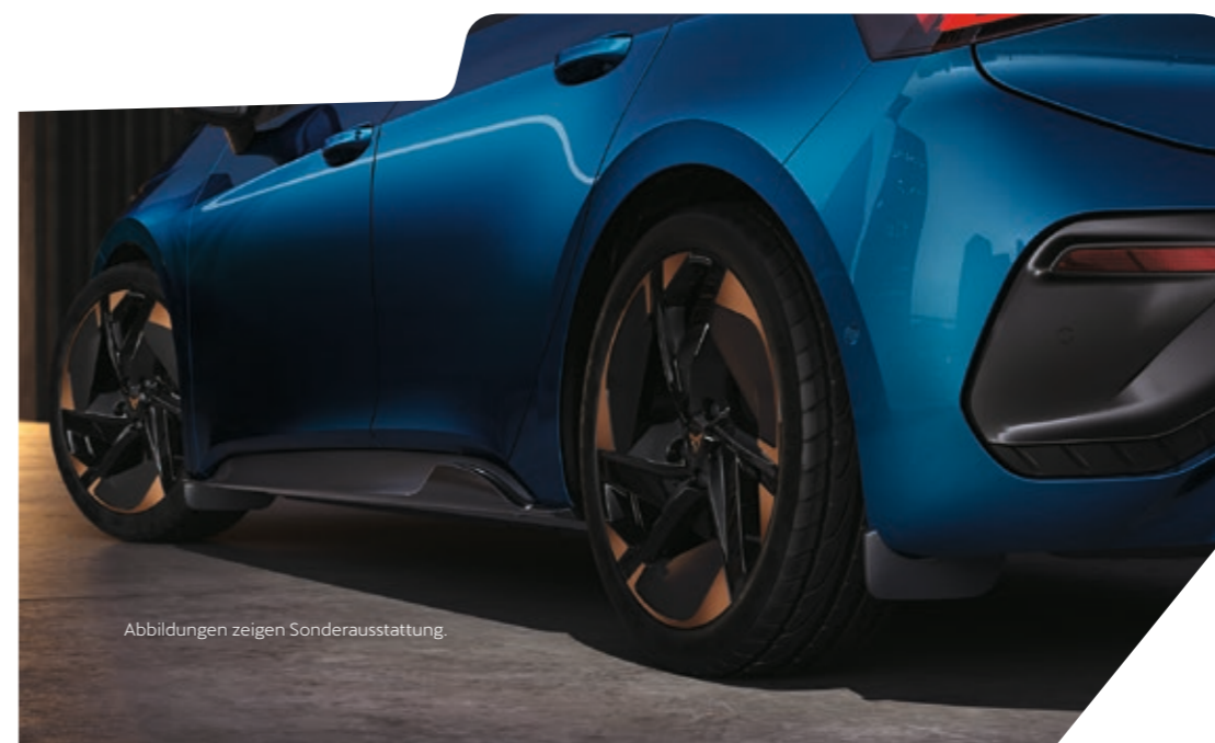
Abbildungen zeigen Sonderausstattung.

Die speziell entwickelten Schmutzfänger schützen den Unterboden und die Karosserie gegen Steine, Schlamm, Splitt und alles andere, was von der Straße nach oben gewirbelt werden kann. Besonders bei sportlicher Fahrweise.