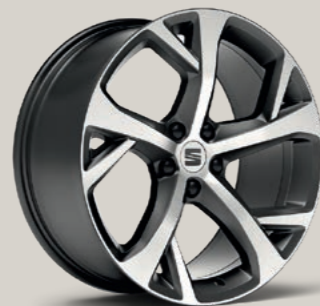
19"-LEICHTMETALLRAD EXCLUSIVE II GLANZGEDREHT FR