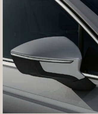
REFLEX SILBER METALLIC St XP