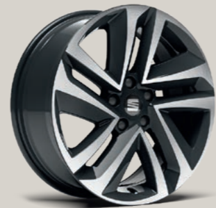
18"-LEICHTMETALLRAD PERFORMANCE GLANZGEDREHT St