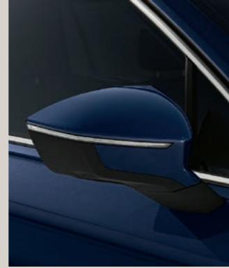
ATLANTIC BLAU METALLIC St XP