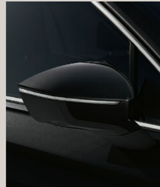
DEEP SCHWARZ METALLIC St XP FR