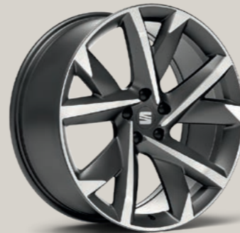
20"-LEICHTMETALLRAD SUPREME II GLANZGEDREHT FR

Style St XPERIENCE XP FR FR Serie ■ Optional ■