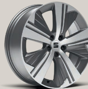
19"-LEICHTMETALLRAD EXCLUSIVE AERO GLANZGEDREHT XP