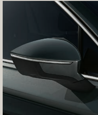
DARK CAMOUFLAGE METALLIC St XP FR