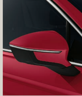
MERLOT ROT METALLIC St XP FR