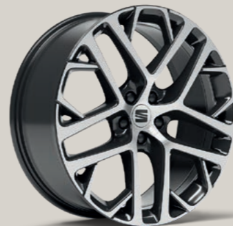
20"-LEICHTMETALLRAD SUPREME III GLANZGEDREHT XP