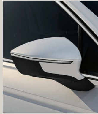
ORYX WEISS METALLIC St XP FR

Style St XPERIENCE XP FR FR Serie ■ Optional ■