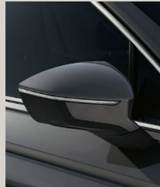
URANO GRAU St XP FR