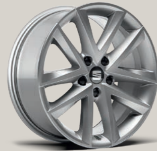
17"-LEICHTMETALLRAD DYNAMIC St