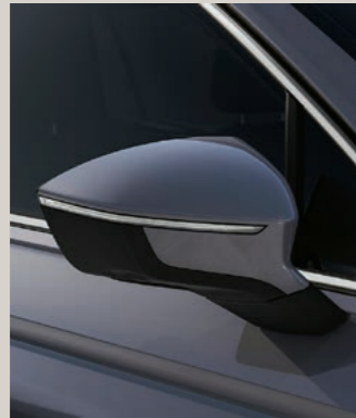
DELPHIN GRAU METALLIC St XP FR